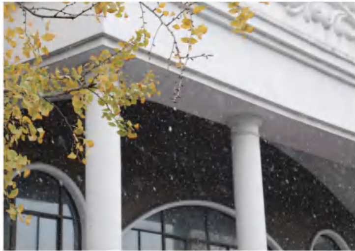
《雪落银杏》 浙江越秀 陈诺