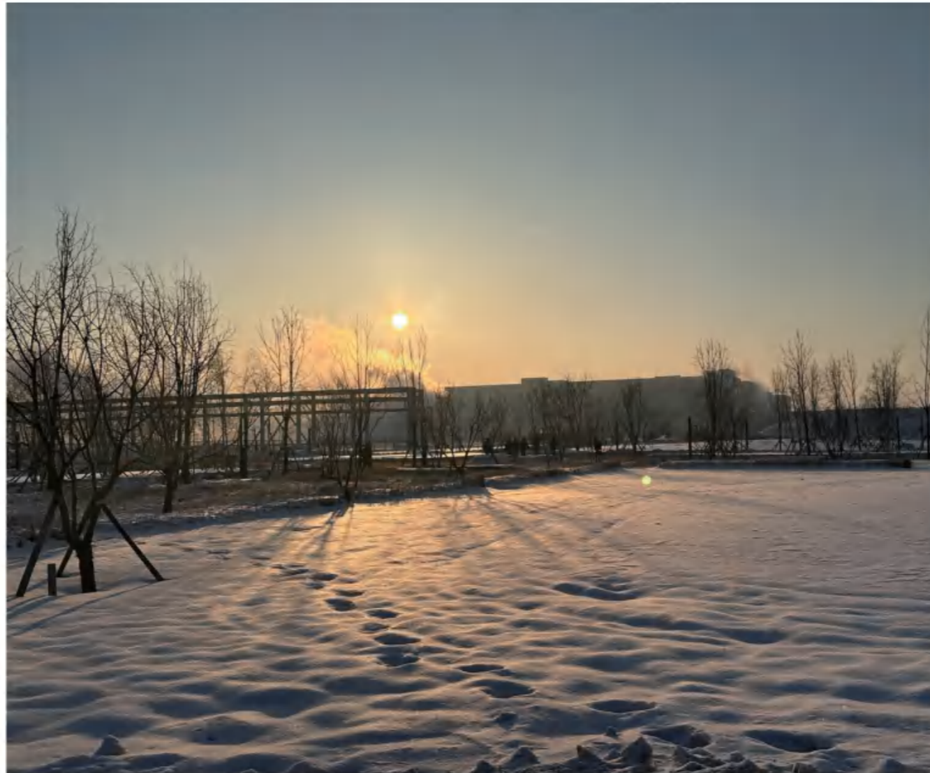
《一步一脚印》 新和成股份黑龙江基地 张琦