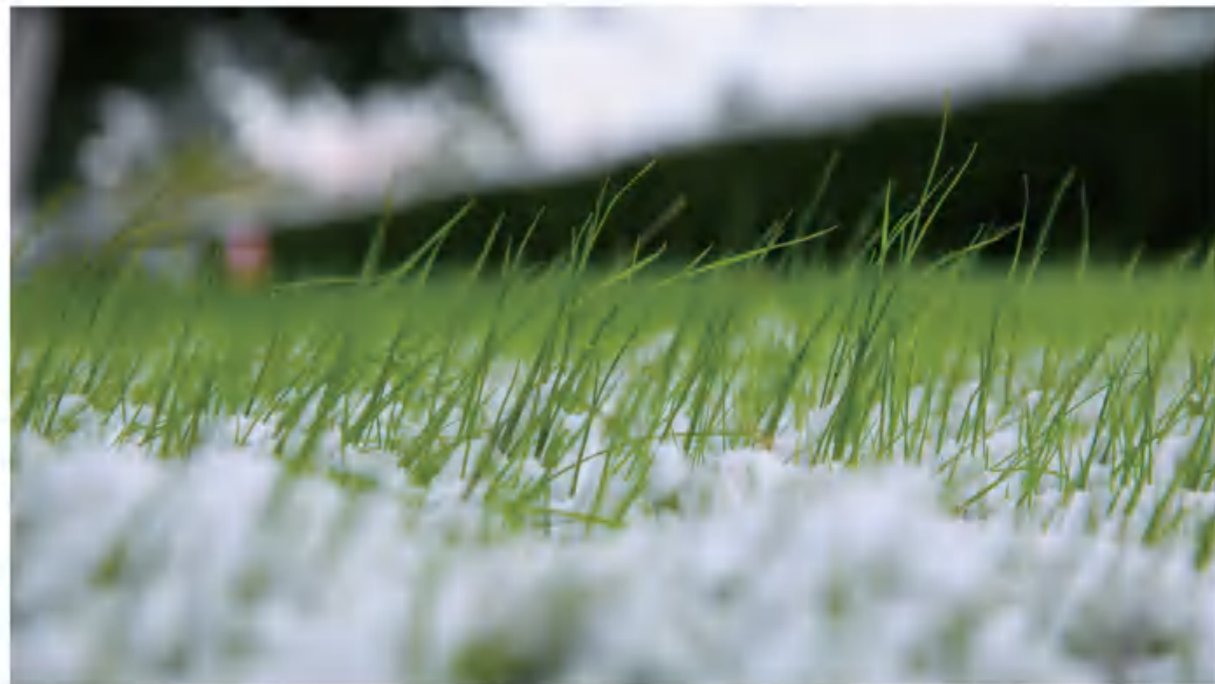
《绿意萌生》 福元医药 徐芳