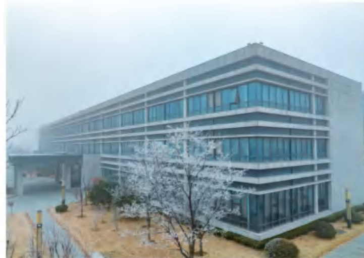
《复见窗户明》 新和成股份山东基地 刘广洲