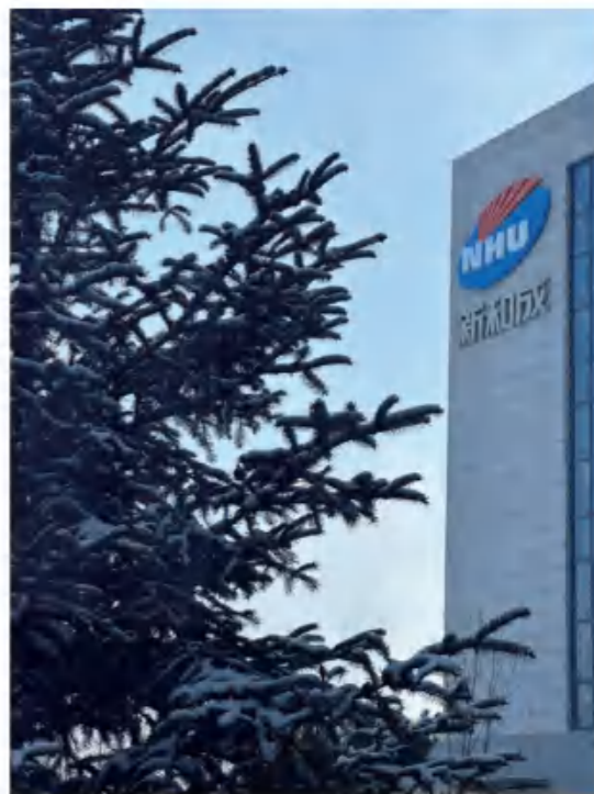
《柏枝映新雪》 黑龙江基地 陈子涵