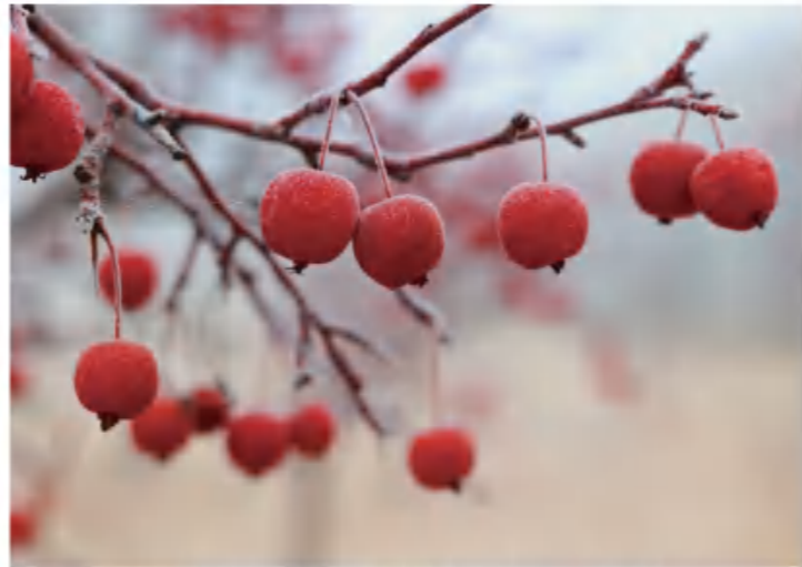
《小小灯笼挂枝头》 新和成股份山东基地 张海波